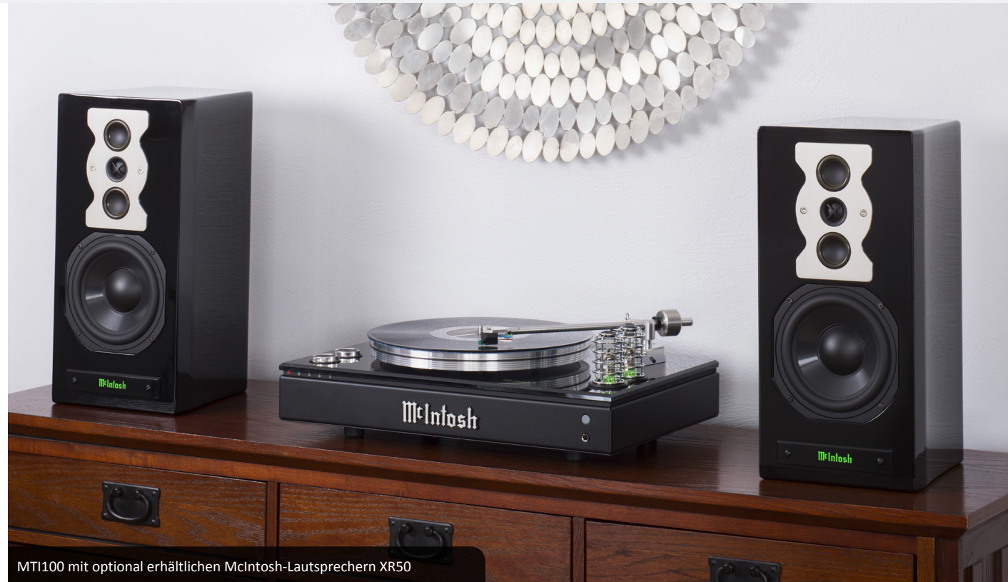
MTI100 mit optional erhältlichen McIntosh-Lautsprechern XR50