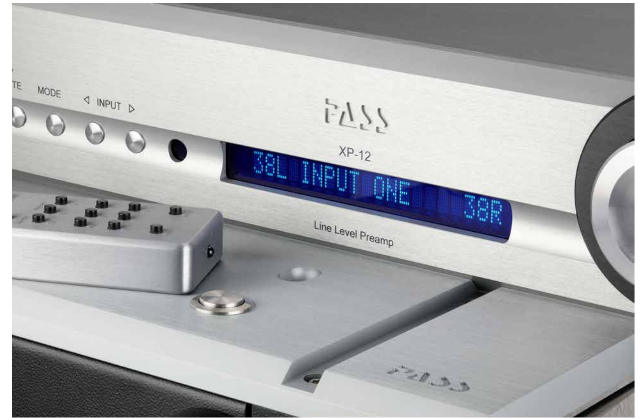
Typisch Pass: Hinter handfester Optik und einigen lässigen Details steckt immer eine sehr gute Verarbeitungsgüte.

Weil die Live-Power, die das Pass-Duo wie selbstverständlich frei Haus liefert, einfach ansteckend ist, ziehe ich nun weitere Live-Scheiben aus dem Regal, delektiere mich zunächst an den ersten Sätzen der herrlich